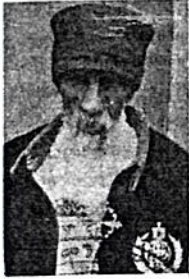
ታላቁ ለት መምህር ገብረ ጊዮርጊስ እግዚእ ነበሩ።

መምህር ገብረ ጊዮርጊስ ገብረ እግዚእ በትግራይ ክፍለ ሀገር በተገንቦን አውራጃ ደብረ ኢየሱስ በተባለው ቀበሌ በ1888 ዓ.ም. ተወለዱ። 12 ዓመት ሲሆናቸው ልዩ ስሙ “እንዳዉኒ” በተባለው ገዳም መገንጠያ ትምህርት መግር ጀመሩ። 18 ዓመት ሲሆናቸው ለመዓርገት ድህረ ስያሜ ለማድረግ ተገምገሟል። ለመዓርገት ድህረ ስያሜ ለማድረግ ተገምገሟል። ለመዓርገት ድህረ ስያሜ ለማድረግ ተገምገሟል።